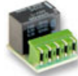
Module à relais N.O.