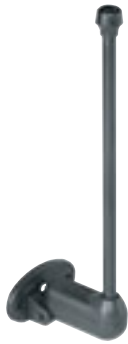
Antenne BIRIO A8