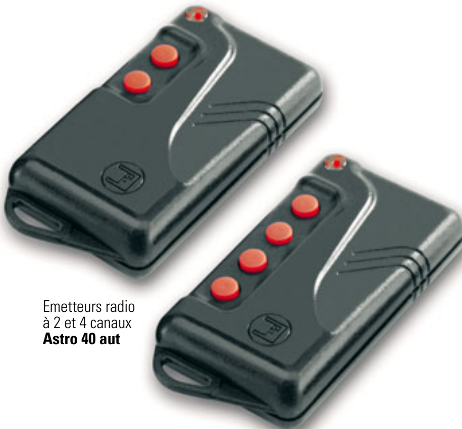
Emetteurs radio à 2 et 4 canaux Astro 40 aut