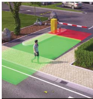
Filter les piétons dans la zone d'ouverture