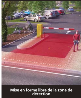
Mise en forme libre de la zone de détection