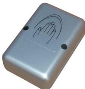
Emetteur mural équipé d'une pile au lithium longue durée